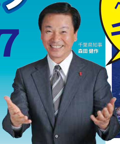
千葉県知事 森田 健作